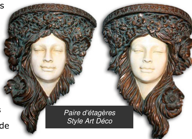
Paire d'étagères Style Art Déco

Charles X et Napoléon III), estimés fort en dessous de leur cotation habituelle. Des prix doux par lesquels MarAuction entend conquérir un nouveau public.