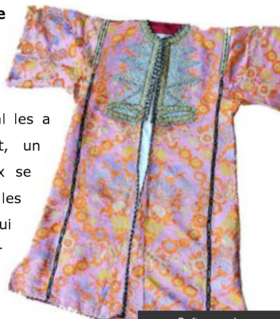
Caftan ancien Tétouan – XIX ème siècle

Les arts traditionnels du Maroc présentent une valeur esthétique aussi bien qu'historique ou anthropologique , désormais incontestée. Paradoxalement, s'ils ont depuis longtemps conquis les acquéreurs étrangers, le public national les a longtemps méconnus, voire négligés. Cependant, un intérêt nouveau pour les créations de leurs aïeux se développe depuis quelques années parmi les collectionneurs et investisseurs marocains, qui apprécient mieux l'étendue et le raffinement de leur propre patrimoine. Une prise de conscience dont se félicite MARAUCTION et à laquelle elle souhaite activement répondre.