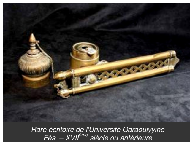
Rare écritoire de l'Université Qaraouiyyine Fès – XVII ème siècle ou antérieure

La vente sera clôturée par des gravures, manuscrits anciens et un ensemble de livres relatifs au Maroc et à ses arts.